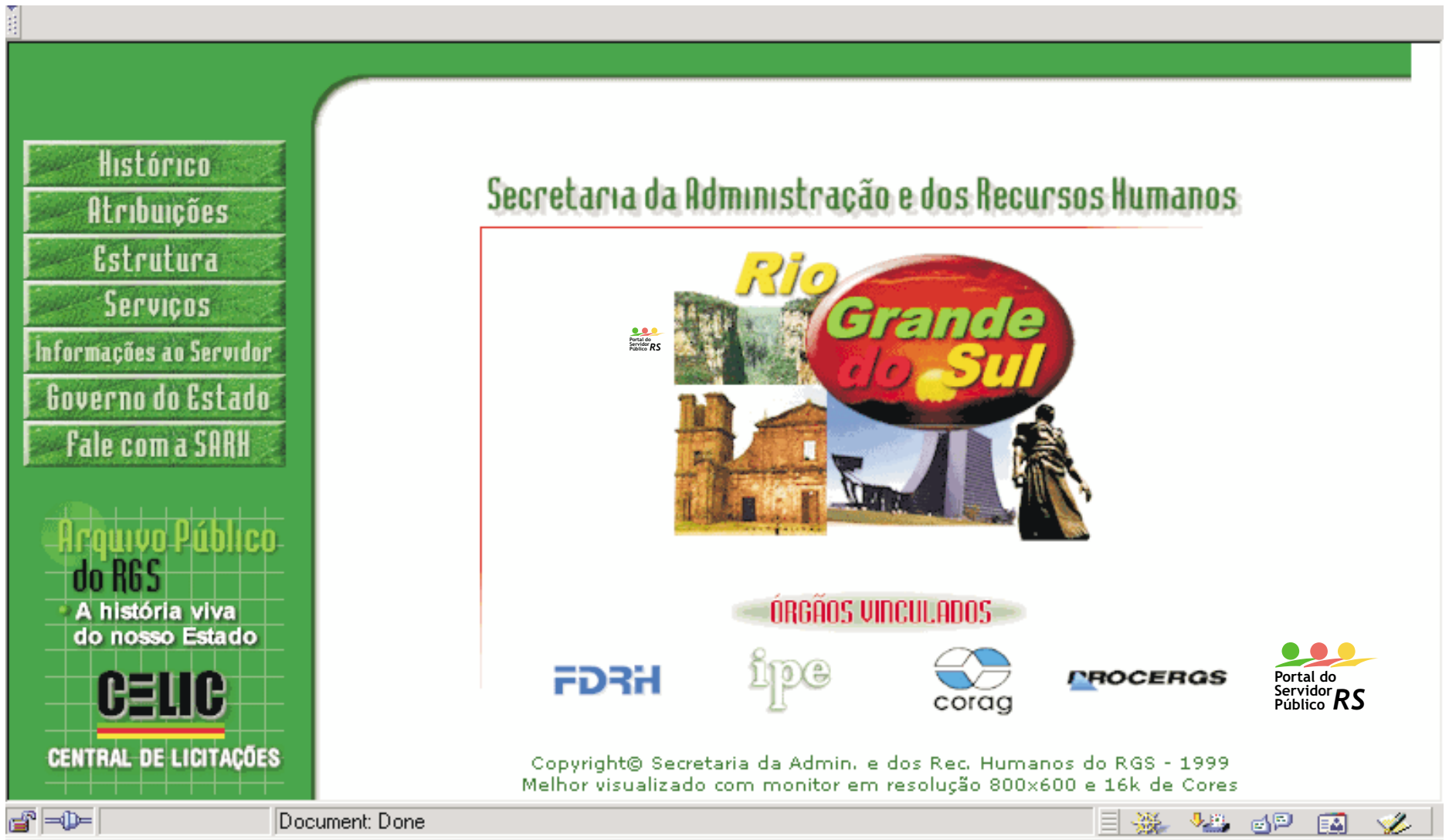
Aplicação tipo link/banner